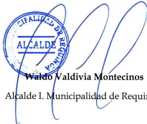
Waldo Valdivia Montecinos Alcalde I. Municipalidad de Requinoa