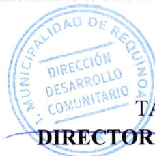
TAMARA POBLETE DINAMARCA