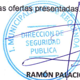
RAMÓN PALACIOS CAMPOS. DIRECCIÓN DE SEGURIDAD PÚBLICA I. Municipalidad de Requínoa